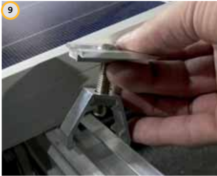
9 Montare il morsetto intermedio