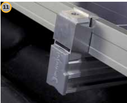
11 Inserire il tappo di chiusura