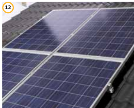
12 VarioSole SE