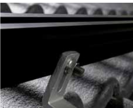
1 Installare le guide di montaggio