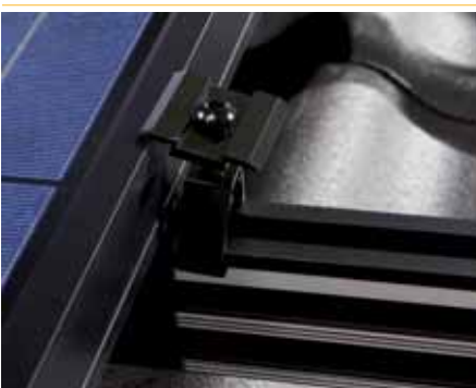
3 Montare il morsetto intermedio