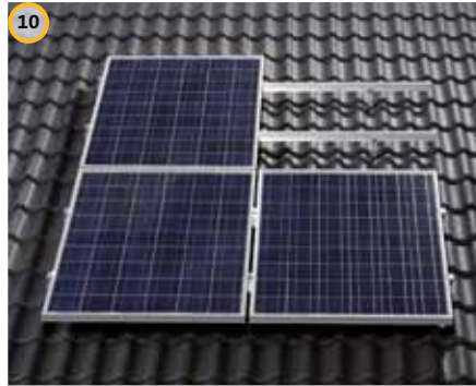
10 Montare la successiva riga di moduli fotovoltaici