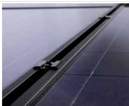
4 VarioSole SE blackline