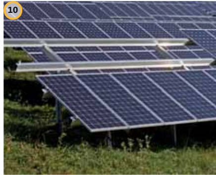
10 Montage der oberen Modulreihe