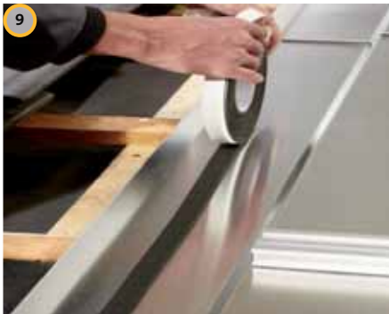
9 Posare la bandella di compressione