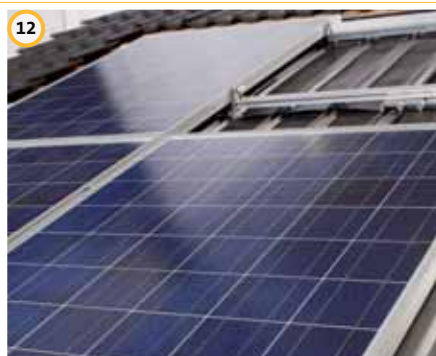
12 Installare gli altri moduli