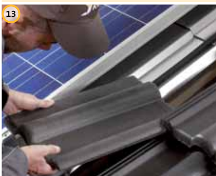
13 Posizionare le tegole sulla scossalina laterale