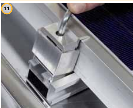
11 Inserire il morsetto terminale sulla guida di montaggio e fissare il modulo fotovoltaico