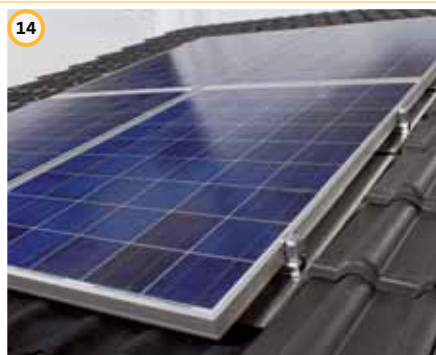
14 InterSole SE